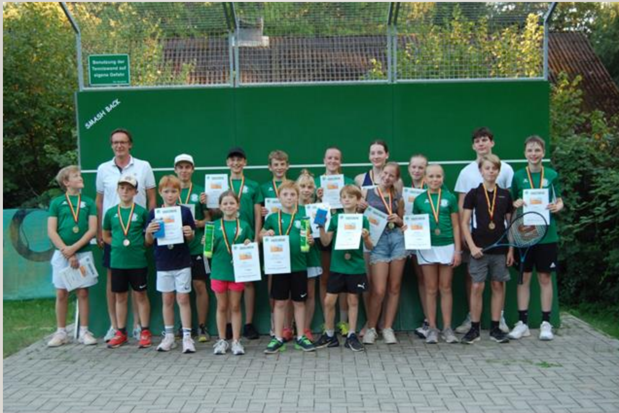
Das Teilnehmenden-Feld bei unserem Jugendclubturnier im September 2023